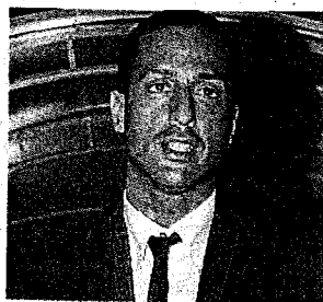
Il fotografo ora è in Brasile a "La Fattoria" DNEWS